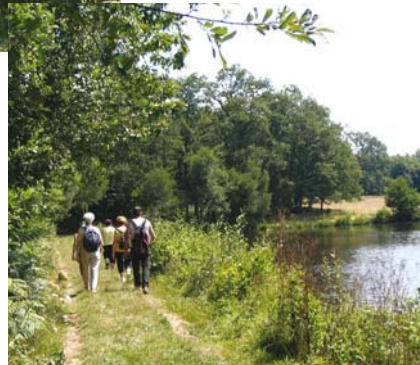
Une randonnée à Pageas