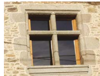
Fenêtre à meneaux à Chenevières