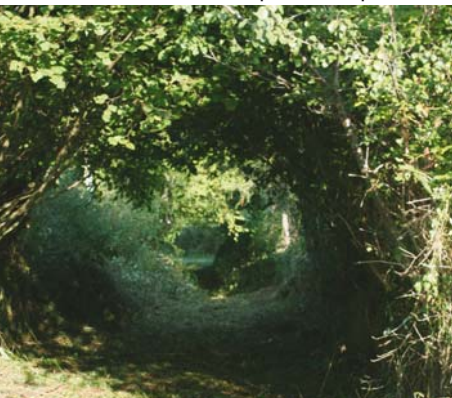
Un chemin creux

Tournez à gauche, suivez le chemin entre deux murs de pierres sèches. Prenez à gauche puis à droite et continuez tout droit jusqu'à l'intersection avec la route. L'empruntez à droite sur 200 m, tournez à gauche et suivez le sentier à travers les prairies. Rejoignez le village de Chenevières et le point de départ.